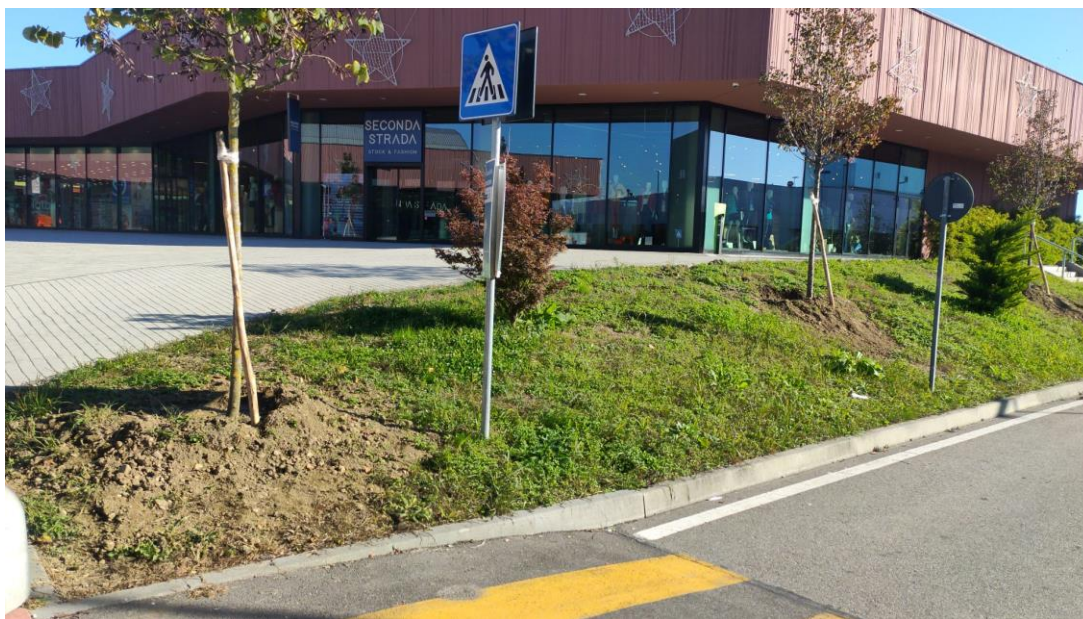
Figura 5– messa a dimora dei Pyrus amelanchier e Cercis siliquastrum

BO.RE SRL P.IVA 12734960011 VIA ALFIERI 6, 10121 TORINO bo.resrl@legalmail.it tel 0115581711