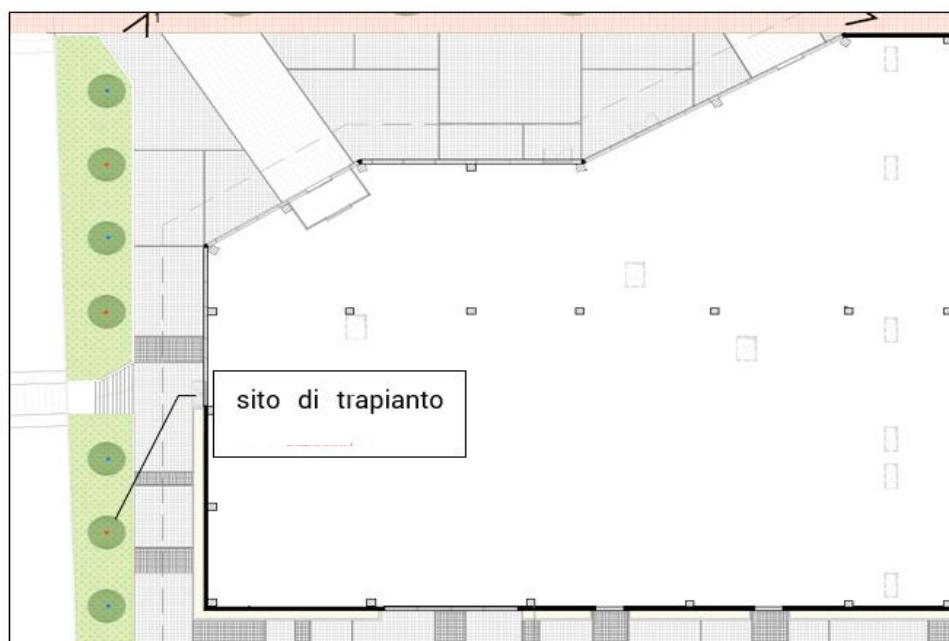
Figura 4– sito di trapianto degli esemplari di Pyrus amelanchier e Cercis siliquastrum

Gli esemplari di Pyrus amelanchier e Cercis siliquastrum precedentemente presenti sono stati trapiantati nella fascia inerbita che è stata realizzata a fianco della viabilità al confine con il lotto E.