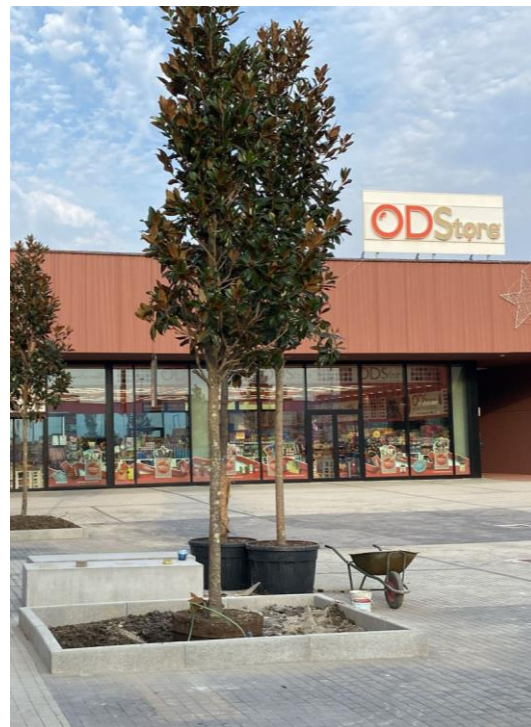
Figura 2 – esemplari magnolia in vivaio e in sito