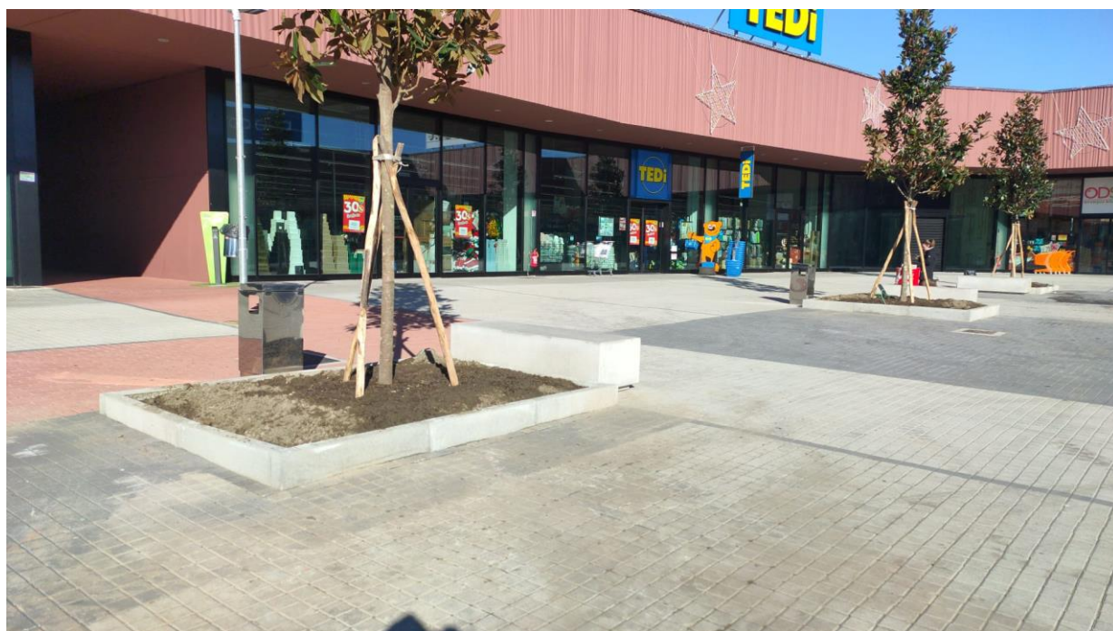
Figura 3 – nuova aiuola

BO.RE SRL P.IVA 12734960011 VIA ALFIERI 6, 10121 TORINO bo.resrl@legalmail.it tel 0115581711